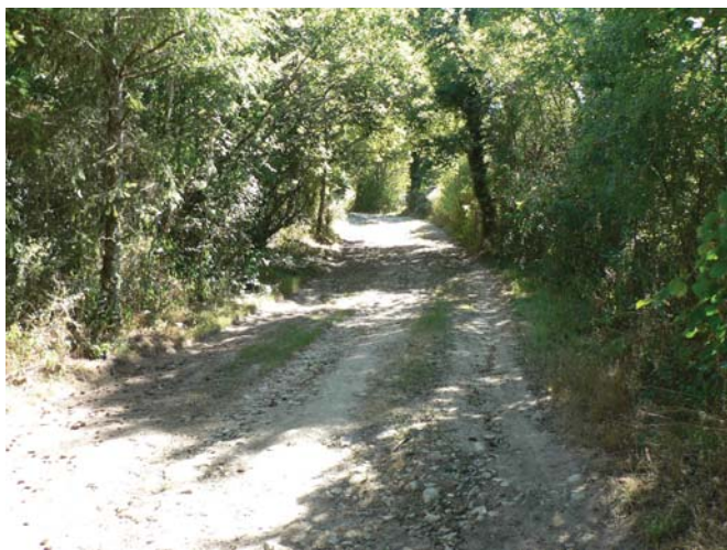
L'ancienne voie royale Poitiers - Limoges

2 La remonter pour retrouver à droite le parking.